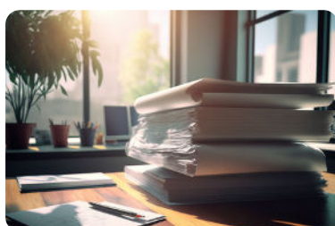
Appels à projets ONPE