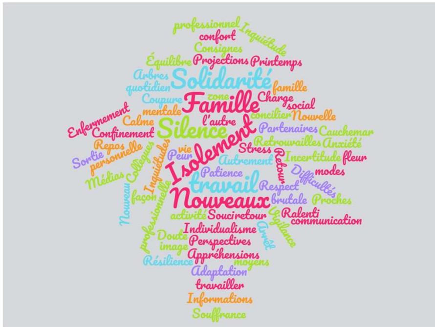
Agents de la DEF