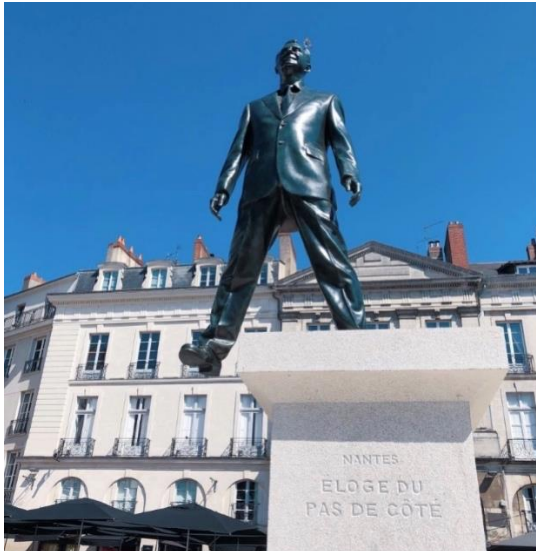
ELOGE DU PAS DE CÔTE - Philippe Ramette

Le lien de connexion pour la journée figurera sur le lien d'inscription.